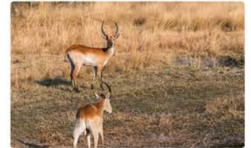
Hide am Kwando GPS: -17.84123, 23.31549

Du erreichst den ersten Beobachtungsstand im Park. Über ein paar Stufen gelangst du zur überdachten Plattform. Von hier hast du eine schöne Aussicht auf die Überschwemmungsebene des Kwando. Letschwe haben ein sehr kleines Verbreitungsgebiet und leben ausschließlich in den Feuchtgebieten, wie du sie vor dir siehst.