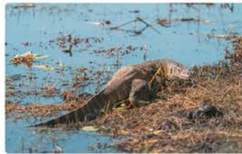
Viewpoint am Okavango GPS: -18.19009, 21.73297

An diesem Aussichtspunkt kannst du direkt auf den Fluss und das Überschwemmungsgebiet blicken. Achte besonders auf die an das Wasser angepassten Tiere wie Krokodile, Nilwarane und Flusspferde.