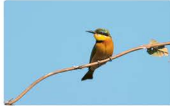
Anthill Viewpoint GPS: -18.17663, 21.73966

Wenn du aus dem Auto aussteigst, musst du auf jeden Fall die Umgebung im Blick behalten. Der Picknickplatz ist von Bäumen umgeben und du hast einen Ausblick auf den Okavango. Von hier kannst du mit einem Kaffee die Tierwelt um dich herum genießen. Achte auf verschiedene Vögel in den Bäumen, wie beispielsweise Riesenfischer und Zwergspint.