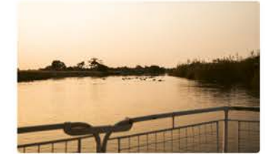
Kazondwe Camp Sunset Bootstour (2 Std.) Namushasha River Lodge Bootsfahrt zum Sonnenuntergang (1,5 Std.)

Zwergspint. Die Unterkünfte am Kwando bieten Bootstouren an.