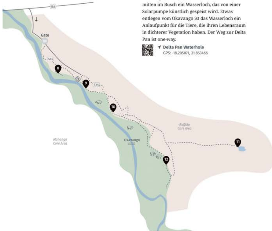
Delta Pan Waterhole GPS: -18.205071, 21.853466

Etwas abseits vom Hauptweg führt ein Weg in Richtung Delta Pan. Ganz am Ende befindet sich mitten im Busch ein Wasserloch, das von einer Solarpumpe künstlich gespeist wird. Etwas entlegen vom Okavango ist das Wasserloch ein Anlaufpunkt für die Tiere, die ihren Lebensraum in dichter Vegetation haben. Der Weg zur Delta Pan ist one-way.