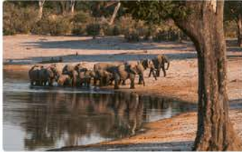
Hide am Horseshoe GPS: -17.89702, 23.28622

Der Beobachtungsstand liegt am Horseshoe. Das hufoisenförmige Gewässer wird aus dem Überschwemmungsgebiet des Kwandos gespeist. Von hier kannst du besonders ab nachmittags zahlreiche Elefanten beobachten, die zum Trinken zum Wasser kommen. Es ist sehr spannend, die Tiere vom offenen Beobachtungsstand aus zu beobachten. Morgens und abends kannst du mit Glück auch Büffel beobachten.