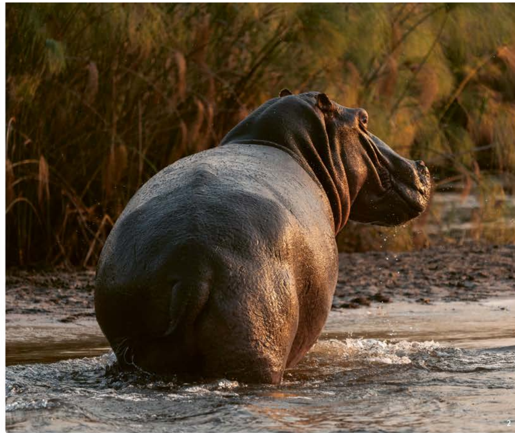
Flusspferde spielen eine entscheidende Rolle bei der Erhaltung des Ökosystems in dieser Region. Sie tragen dazu bei, die Wasserqualität zu verbessern und die Vegetation zu erhalten.

Für Vogelliebhaber ist dieser Teil Namibias ein Muss. Mehr als 340 Vogelarten wurden bisher gezählt und der Bereich entlang der Flüsse weist eine besonders hohe Vogelvielfalt auf. Selbst wenn du dich bisher nicht besonders für Vögel interessiert hast, im Caprivi wirst du zum Birder. Egal, ob du den farbenprächtigen Haubenzwergfischer beobachtest oder in der Ferne den imposanten Schreiseeadler erspähist, die Vogelwelt wird dich in ihren Bann ziehen.