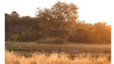
Hide an der Long Lagoon GPS: -17.87790, 23.30469

Der Beobachtungsstand liegt direkt an der "Long Lagoon". Dank der erhöhten Lage hast du nicht nur eine super Aussicht auf das Gewässer, sondern auch auf den Sonnenaufgang. Bringe Kaffee und Rusk (Gebäck) mit - das typische Frühstück auf Safari. In der Lagoon leben Krokodile und Flusspferde. Achte auch auf Graufischer, die im Rüttelflug nach kleinen Fischen im Wasser jagen. Der Beobachtungsstand lohnt sich auch am späten Nachmittag, wenn mit etwas Glück zahlreiche Elefanten zum Trinken kommen.