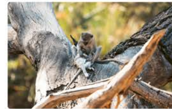
Kwetche Picnic Spot GPS: -18.22226, 21.75281

An dieser schattigen Stelle kannst du eine Pause einlegen. Durch die Bäume kannst du den Fluss sehen. Wenn du eine Weile bleibst, siehst du vielleicht ein Krokodil. Achte auch auf Grünmeerkatzen und Zwergspintie in der Umgebung.