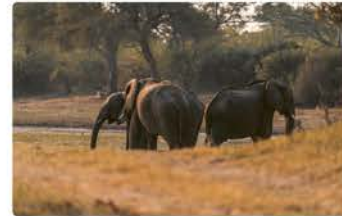
Track am Ufer GPS: -18.227735, 21.790098

Eine Fahrt entlang des Überschwemmungsgebietes ist besonders am frühen Morgen oder späten Nachmittag nicht nur landschaftlich wunderschön, sondern auch sehr tierreich. Büffel und Elefanten kommen vor allem zu diesen Tageszeiten zum Trinken an den Fluss. Wenn du Glück hast, kannst du große Herden beobachten. Plane besonders nachmittags ausreichend Zeit für den Rückweg ein, da die Tiere manchmal den Weg versperren und natürlich Vorfahrt haben.