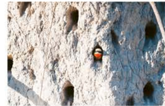
Flussufer am Kwando GPS: -17.9511476, 23.2964555

An den Ufern des Kwando gibt es sandige Steilufer, an denen sich die Nisthöhlen der Weißstirnsperlinge befinden. Die Vögel graben einen 1-2 m langen Tunnel, an dessen Ende sich die Nisthöhle befindet. Wenn du am Flussufer entlang fährst, halte nach den Höhlen Ausschau. Von diesem Spot aus kannst du die Höhlen gut entdecken.