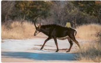
Track durch Baumsavanne GPS: -18.15565, 21.71578

Die Antilopen im Bwabwata haben unterschiedliche Lebensräume. Im Schutz des Waldes und nahe am Wasser kannst du den Buschbock finden. Ebenso in der Baumsavanne, aber im hügeligen Gelände findest du den Kudu. Die Rappenantilope und die Pferdeantilope sind ebenfalls auf ihren Wanderungen durch die Baumsavanne zu finden. Das Impala kannst du in der Übergangszone zwischen Gewässern und Baumsavanne finden.