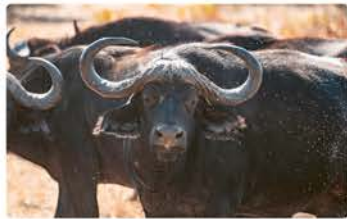
Track am Ufer GPS: -18.175974, 21.701718

Im Mahango kannst du Büffelherden mit älteren männlichen Tieren finden. Diese Büffel sind schnell reizbar und pflanzen sich aufgrund ihres Alters nicht mehr fort. Sie leben daher getrennt von den fortpflanzungsfähigen Herden. Die alten Büffel werden auf Swahili Dagga Boys genannt, was so viel wie Mud Boys bedeutet. Übrigens kannst du männliche und weibliche Büffel am Gewicht unterscheiden. Die Männchen sind doppelt so schwer wie die Weibchen. Außerdem ist das Horn der Weibchen zierlicher.