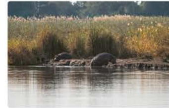
Flussufer Kwando GPS: -17.9326552, 23.3021776

Der Kwando schlängelt sich in zahlreichen Windungen durch die Landschaft. An dieser Stelle kommst du ziemlich nah an den Fluss heran und hast durch die leicht erhöhte Lage einen guten Blick auf das Wasser. Neben Flusspferden kannst du auch verschiedene Vögel beobachten. Schau doch mal, ob du das Blaustirn-Blatthühnchen oder den Hammerkopf entdecken kannst.